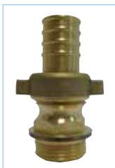
Rechte 3-delige slangkoppeling met vleugelmoer