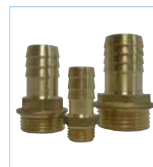
Messing slangtule met buitendraad