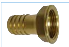
Messing slangtule met binnendraad