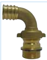
Haakse 3-delige slangkoppeling met vleugelmoer